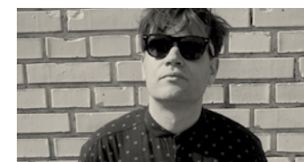
ANDERS TRENTEMØLLER (Edition Babelfish / Rückbank)