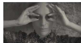
AGNES OBEL (Universal Music Publishing)

For værkerne på albummet "Citizen Of Glass"