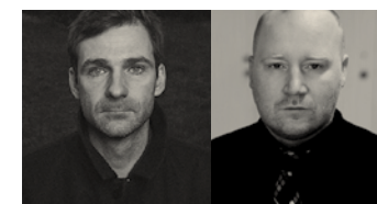
JONAS COLSTRUP & JOHANN JOHANNSSON (Mute Song Ltd.)