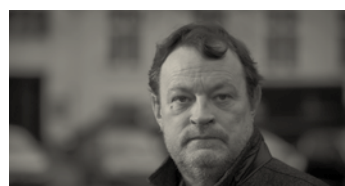
BENT SØRENSEN