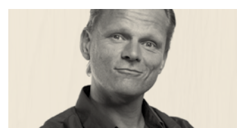
SIGURD BARRETT (Dansk Sang)

For udgivelsen "Sigurds Danmarkshistorie"